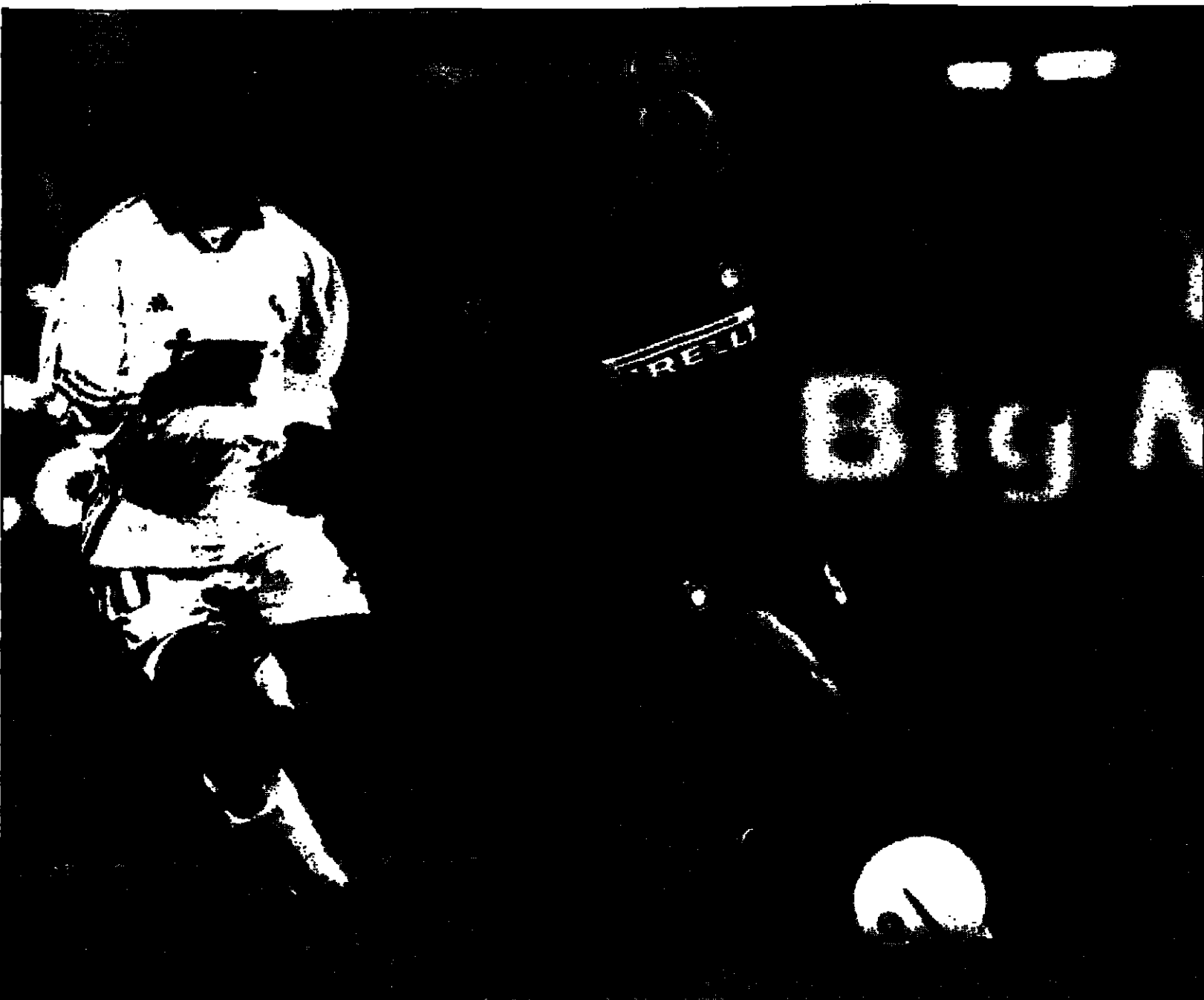
رونالدو (الى اليمين) نجم فريق البرتلان الايطالي في هجمة على مرمى ريال مدريد ويظهر الى جانبه نجم النرويج سيوف، يحاول ايقافه في المباراة التي اقيمت بين الفريقين الاربعة

■ نيلوسيا - اف بي: خرجت ثلاثة فرق عربية من الدور الاول لسابقة دوري ابطال اوروبا في كرة القدم هي برشلونة الاسبانية وارسانال الانكليزي وبورتو البرتغالي، ويات كايزرسلوترن الاتالي اول فريق يبلغ الدور ربع النهائي، في حين اقترب انتر ميلان الايطالي من بلوغ المسابقة في نهاية الجولة الخامسة مساءً في مباراة مع روما.